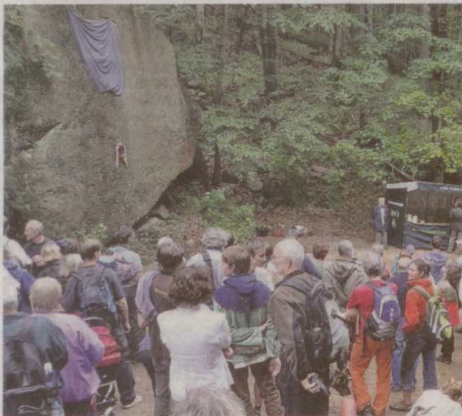
INSTALACE PAMĚTNÍ DESKY nad Ferdinandovem v Jizerských horách se stala malou slavností.

Její v té době nepřilíhš šťastný život ukončil roku 1898 italský anarchista Luigi Lucheni, který ji probodl pilníkem, když byla na cestě do ženevského přístavu. Tak předčasně skončila nejen tato zahraniční cesta, ale i její složitý život. Atentátník chtěl údajně původně zabít prince z Orléans, nakonec si vybral za oběť císařovnu. Bylo jí 61 let.