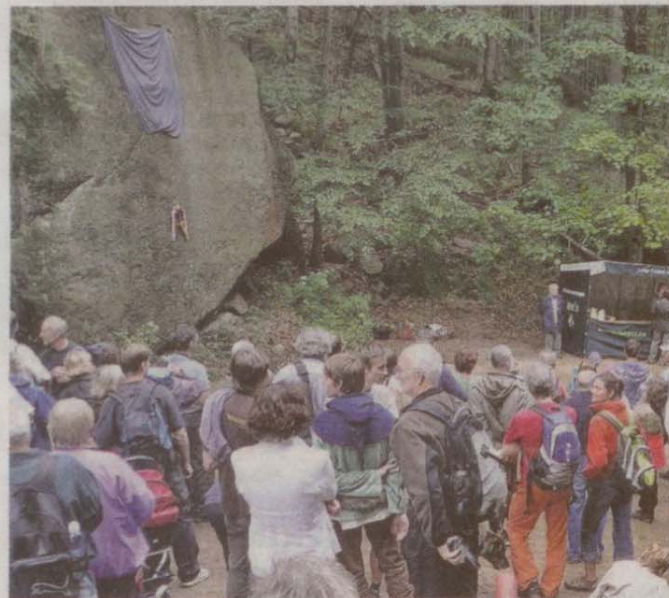
INSTALACE PAMĚTNÍ DESKY nad Ferdinandovem v Jizerských horách se stala malou slavností.

„Obnovu pamětní desky císařovny Alžběty vnímáme jako navrácení významného kulturního prvku do krajiny Ji-