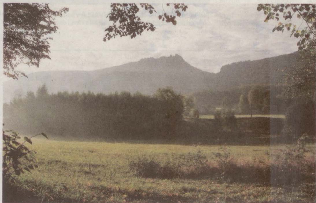
PODZIM POD FRÝDLANTSKÝM CIMBUŘÍM, Alena Režná