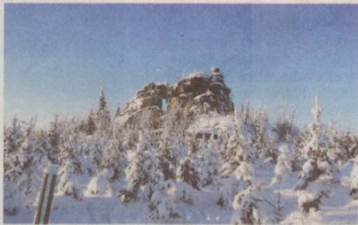
ZIMA NA PYTLÁCKÝCH KAMENECH, Jitka Křelinová