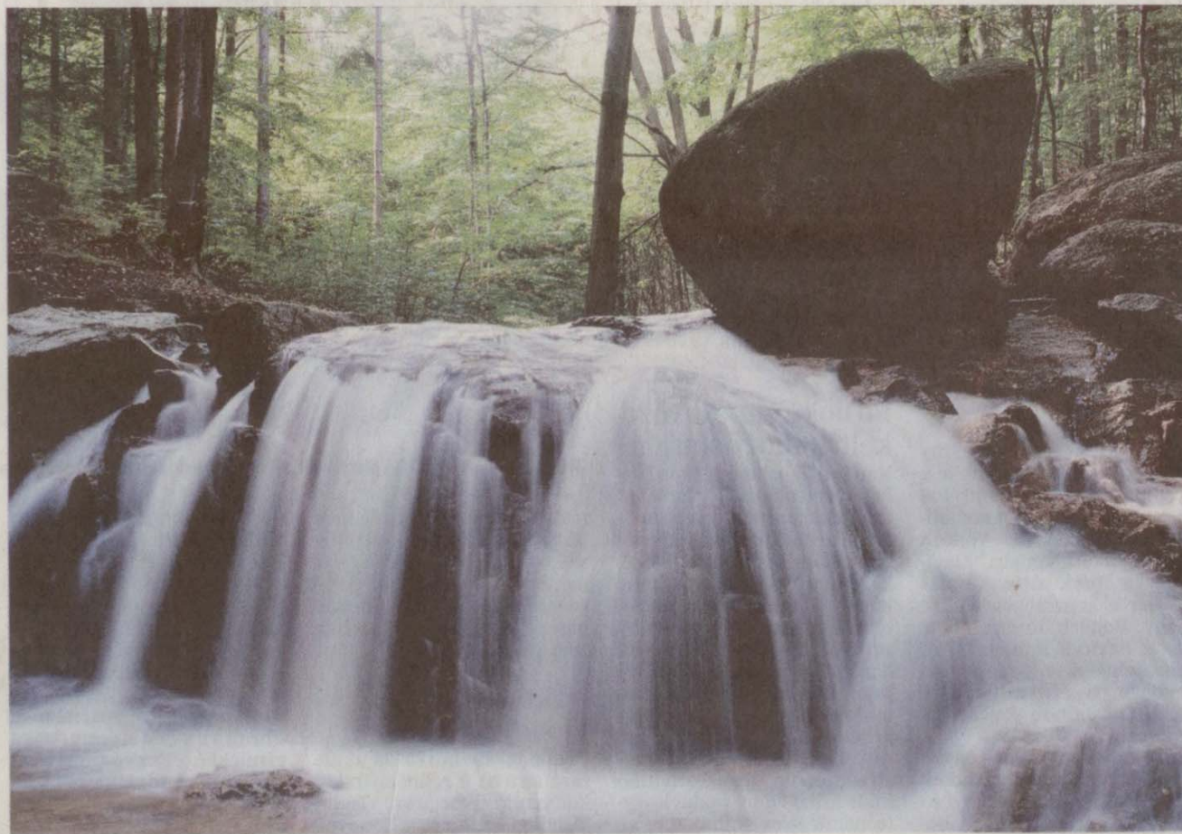
PEŘEJE NA MALÉM ŠTOLPICHU, Václav Lahovský

Přinášíme vám další „ochutnávku“ ze soutěžních prací a připomínáme, že pokud fotografujete, máte ještě čas do soutěže se zapojit! Více info na: http://jizerky.ecn.cz/ (red)