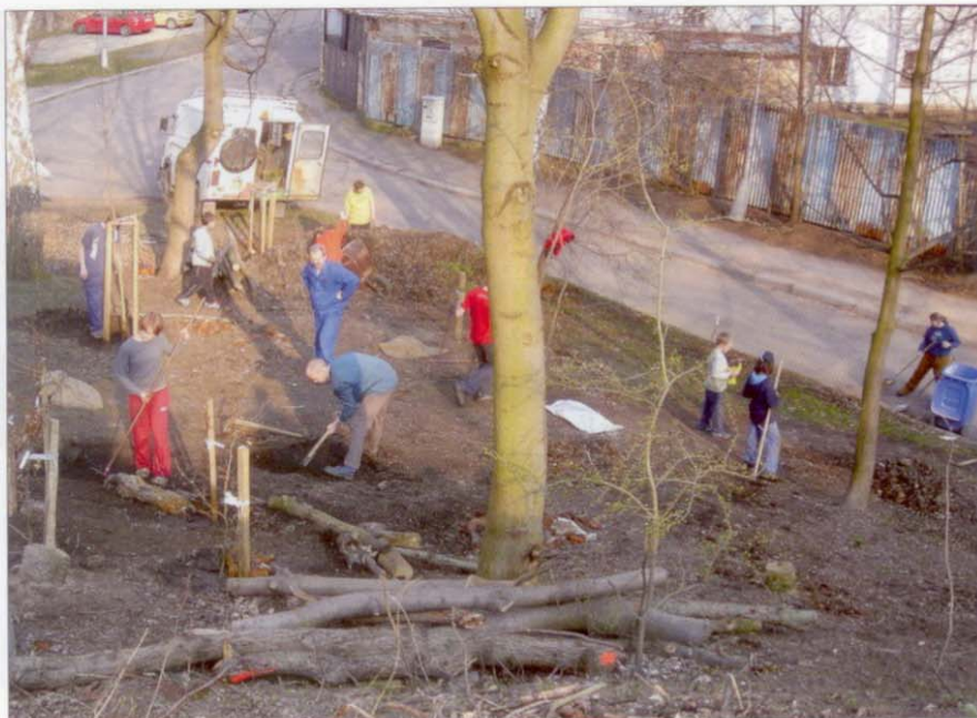
Členové turistického oddílu Kletr přeměňují zanedbanou městskou zeleň v Liberci v udržované arboretum