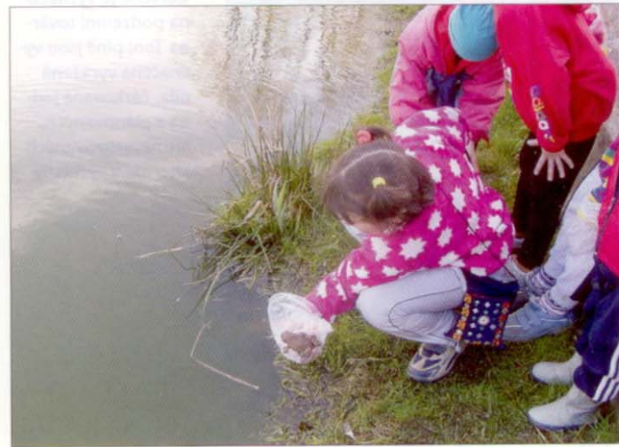
Děti ze základní školy Nová Ves pomáhají při sázení stromků na školní zahradě. Žáci základní školy Dubá chrání obojživelníky při jejich jarním tahu