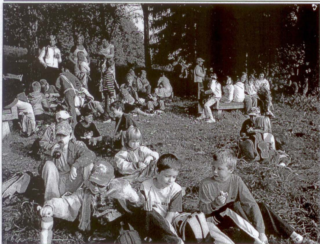
Výlet na Špičák. Ve škole jsme se dohodli, že půjdeme na Špičák. Šli jsme Žďárem, cesta na Špičák byla moc úzká. Když jsme tam došli, bylo zavřeno. Vylezli jsme tedy aspoň na kamennou vyhlídku. Vrátili jsme se přes sedlo. A každému bylo dobře, ta cesta se mi líbila.