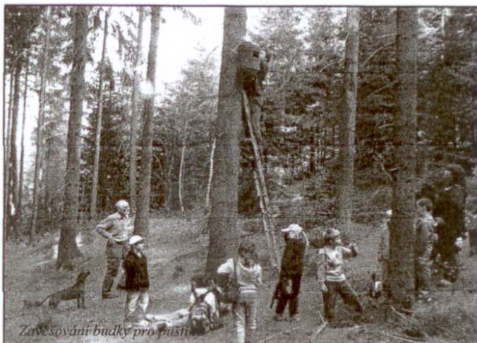
Zavěšování budky pro puštíka

V pátek 17. dubna se děti z mateřské a základní školy za doprovodu učitelů a dobrovolníků z řad dospělých zúčastnily akce spolku Novovesan pod názvem Jarní budkování 2009. Hlavním úkolem akce bylo rozmístit hnízdní budky pro ptáky. Protože se jedná o činnost vyžadující znalosti odborníků, byla celá akce připravena a spolurealizována s Lesy České republiky - Lesní správa Jablonec nad Nisou. Dozvěděli jsme se o různých hnízdních nárocích ptactva, vhodném způsobu umístění budek ve vztahu ke světovým stranám, přirozenému prostředí a o zabezpečení budek proti predátorům. Děti měly možnost si je prohlédnout a asistovat lesníkům panu Polákovi a panu