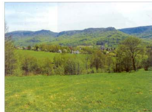
Strmé severní svahy nad Hejnicemi s NPR Jizerskohorské bučiny

Objevily se i názory, že ochrana těžce zkoušených hor pozbyla významu a CHKO by mohla zaniknout. Není ovšem pochyb o tom, že existence CHKO byla významnou skutečností, která dokázala v časech minulých v pozitivním smyslu ovlivnit vývoj zdejší přírody a krajiny. Dnes je CHKO Jizerské hory prostředím, ve kterém je mnohem snazší iniciovat a koordi-