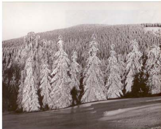
Holubník (1 069 m) před vyhlášením již zániklé rezervace

Květnový jizerskohorský program ke 40. výročí vyhlášení Chráněné krajinné oblasti Jizerské hory je mimořádně bohatý. Neváhejte a vyberte si z řady akcí, které připravuje Správa CHKO Jizerské hory ve spolupráci s dalšími organizacemi a za podpory ministerstva životního prostředí a Libereckého kraje.