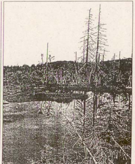
Rada stromů v okolí Čihadle se v minulosti odtěžila a dnes se tu týčí jen pahýly odumřelých smrků.