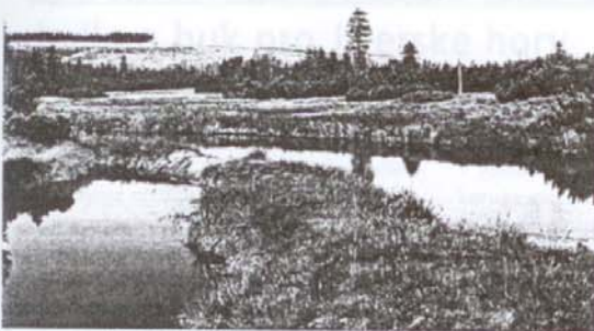
Národní přírodní rezervace Rašeliníště Jizery

V roce 1994 investovala Nadace do praktických prací ve zvláště cenných územích Jizerských hor a do aktivit výzkumných a odborných asi 1,5 milionu Kč. Letos práce pokračují, rozpočet pro příští rok činí 1 milion Kč. Nadace je řízena správní radou, o své činnosti vydává výroční zprávu